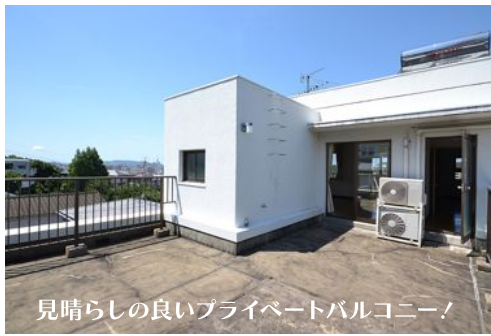
見晴らしの良いプライベートバルコニー！

丘の上に建つ戸建て。2階のバルコニーからは福岡市内が一望！！ 専用庭、そして広いルーフバルコニーでは、みんなで集まってバーベキューなんかもできちゃいます！