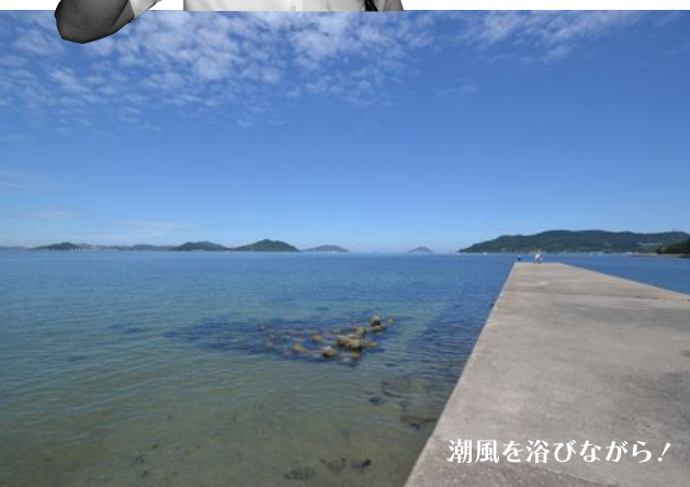
潮風を浴びながら！