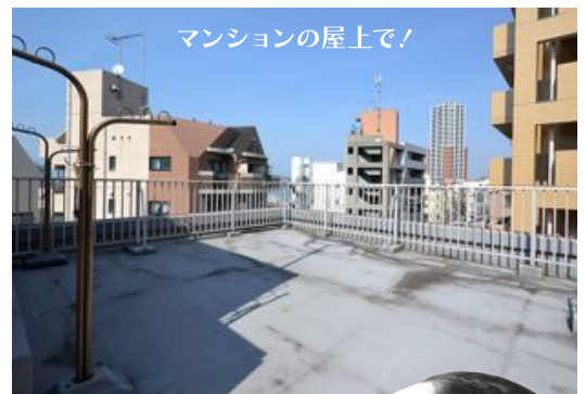
マンションの屋上で！

シーサイドに建つ、365日リゾート気分が味わえるマンション。エントランスを出て1分で海に行けちゃいます！最高に夏とビールを満喫できるシチュエーションです！